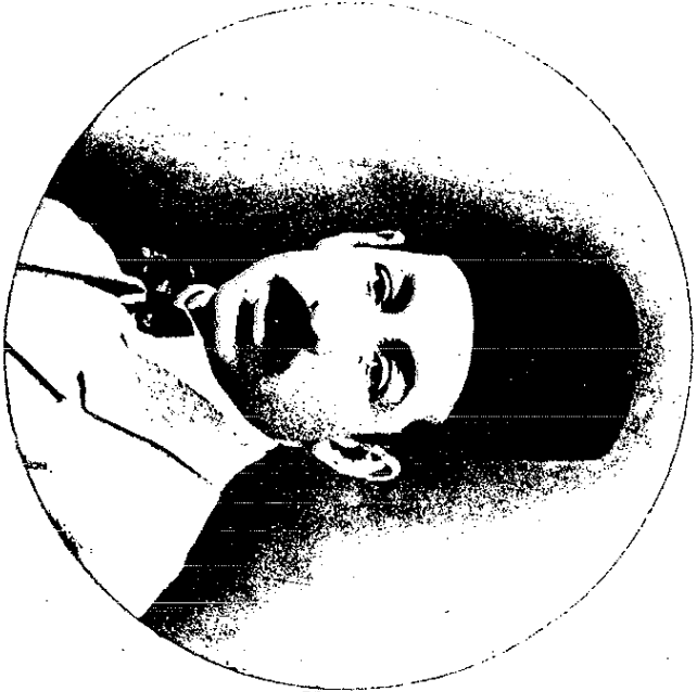
استاذ مصطفى صادق الرفاعي